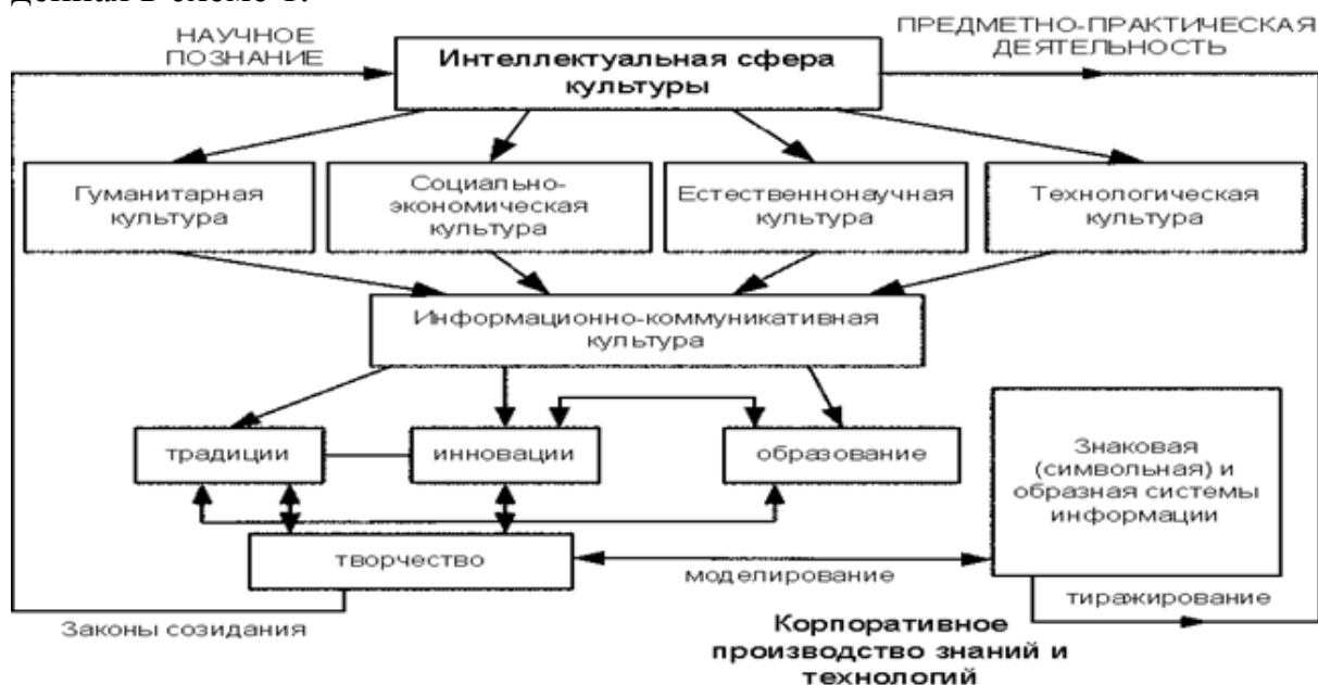
Схема 1. Структура интеллектуальной сферы культуры.

В данной работе программные кластеры мы центрируем на заданные ФГОС 3+ компетенции: Уровень высшего образования: БАКАЛАВРИАТ; направление подготовки 11.03.04 Электроника и наноэлектроника [9] и соответствующие им дисциплины профиля «Светотехника и источники света» [6]. При этом используется структура интеллектуальной сферы культуры, рассмотренная нами в работах [4, с. 3-7] и [5, с. 90-95] и приведенная в схеме 1.